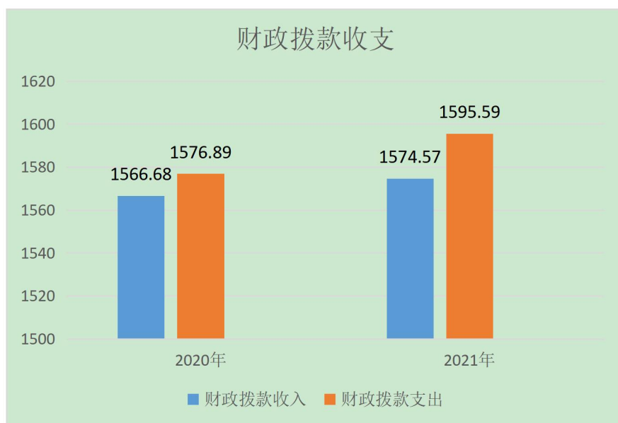
图 3：财政拨款收支与 2020 年度决算对比情况