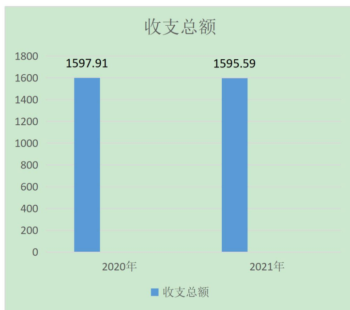
图 1：收入支出决算情况

本单位 2021 年度收、支总计（含结转和结余）1595.59 万元。与 2020 年度决算相比，收支各减少 2.32 万元，下降 0.2%，基本与上年持平。