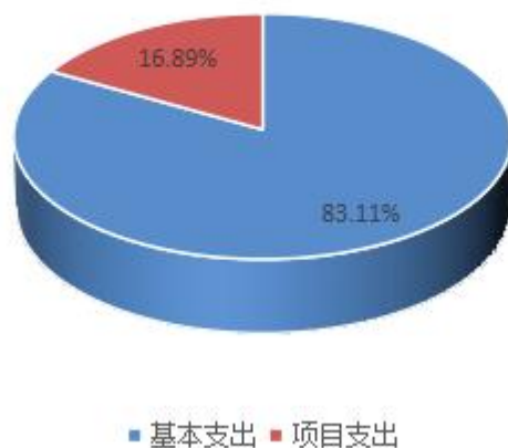
图2：支出决算构成情况（按支持性质）