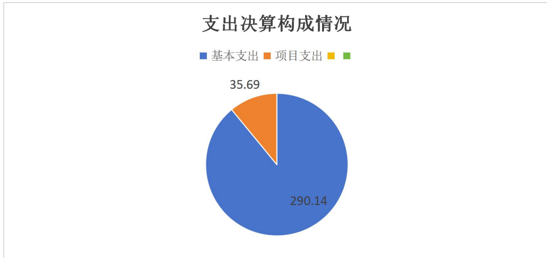
图 2: 支出决算构成情况 (按支出性质)